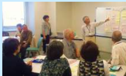
発足のための検討会

心灯して明かり消えよう。 あなたの少しの優しさを待っている人がいます 東日本大震災復興支援綾瀬プロジェクト