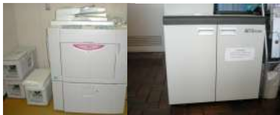
新規に購入した印刷機（左）とシュレッダー

印刷機は多機能印刷機で、両面同時印刷や2色同時印刷ができます。また、USBメモリーなどでデータをお持ちいただければ、直接印刷ができ、よりきれいに仕上がります。従来の印刷機も引き続きご利用いただけます。