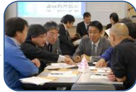
提案者と協働相手候補との個別協議