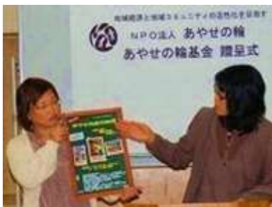
受贈団体の活動報告

NPO法人 あやせの輪 による市民活動団体への活動資金「あやせの輪基金」の贈呈式が11月28日中央公民館講堂で開催され、今年度は11団体に贈呈されました。