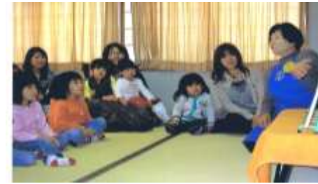
楽しそうにお話を聞く子どもたち

私たち「おはなしぽっぽ」は、子どもたちの健全育成を目的に、平成19年4月に発足しました。毎月第2金曜日に北の台地区センターで活動しています。