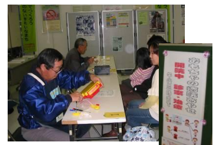
『おもちゃの病院あやせ』