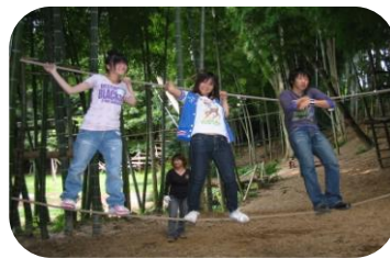
ドリームプレイウッズ