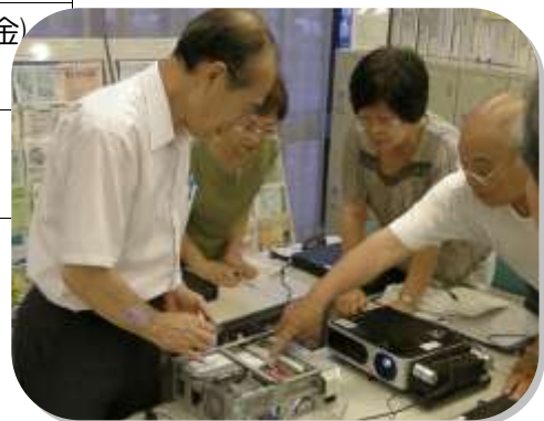
パソコンリフレッシュ講習会