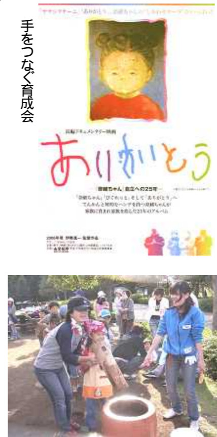
手をつなぐ育成会

市民の参加できる事業は、広報あやせ や 市民活動センターあやせ ホームページ等を通じて募集する予定です。お見逃しなく! お問い合わせは、各団体に直接又は市民活動センターあやせ(70-1232)まで