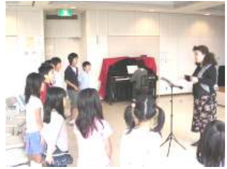
キッズコーラス練習の様子