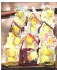
「希望の家」のマドレーヌ