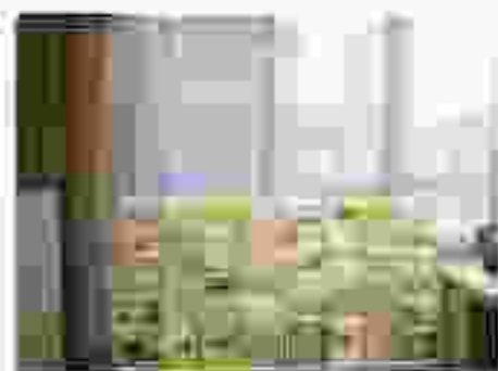
市民活動関係の情報掲示板