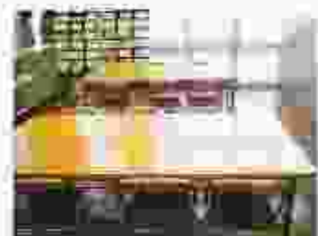
新聞の切り抜きコーナーが設置されています。