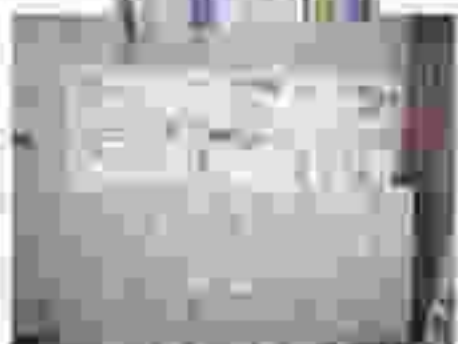
ロッカーの上には各冊子の貸出の本があります。 <A>の情報や <B>のパソコンコーナーの情報 が掲載されています。