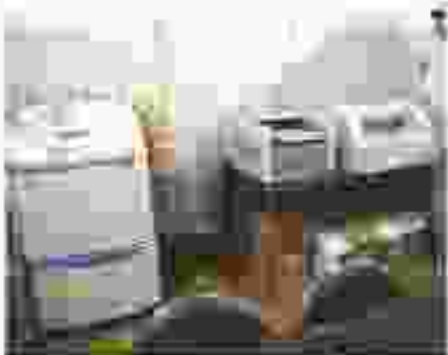
印刷・新着・新着の機がある 所!! いろいろと作業ができます