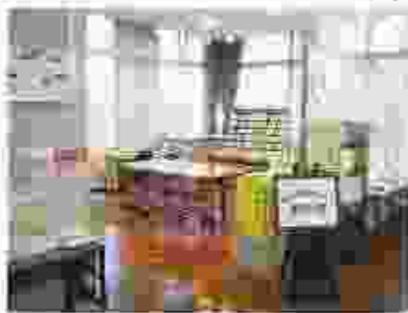
こちらが入り口です