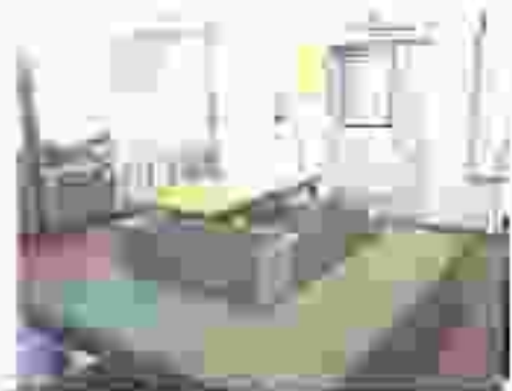
市民の方の交換の場 三ヶ所あります 右側にもあります。