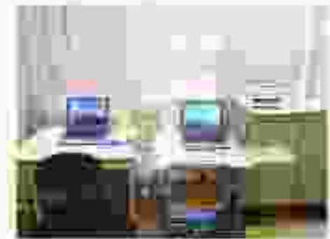
他市のパソコン情報コーナー