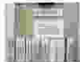
新聞の切り抜き お役立ち情報