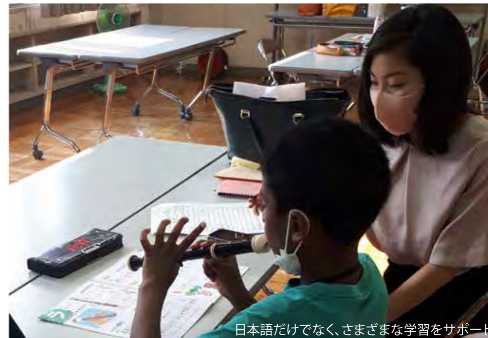
日本語だけでなく、さまざまな学習をサポート

「にぬふあぶし」は、2020年4月に発足、綾瀬市に住む外国ルーツの小・中学生を対象に、春・夏・冬の長期休みを利用し、市内6か所の地区センター等で、午前・午後の2時間、日本語や宿題を教える巡回教室を開いており、現在6名のメンバーで運営されています。