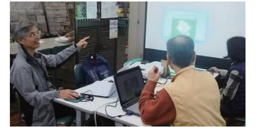
やりたいことを叶えるヒントを探そう!

市民活動には、福祉・介護、健康づくり、まちづくり、文化・芸術・スポーツ育成、環境保全、災害救援、地域安全、国際協力、こどもの健全育成等、幅広い分野があります。詳しく知りたい方は、一度センターへお越し下さい。各団体の紹介カードや開催するイベントのチラシのほか、近隣市の市民活動情報紙やチラシ等、揃っているので、情報集めが出来ます。何かあれば、どうぞお気軽にスタッフへご相談ください。