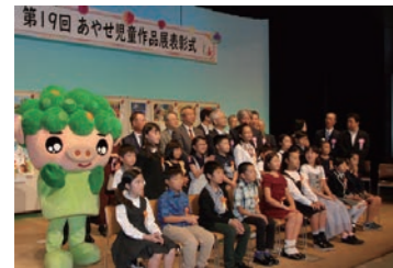
受賞した子ども達とパチリ

10月7日綾瀬市オーエンス文化会館小ホールで平成30年度第19回目のあやせ児童作品展受賞者の表彰式が行われました。市内全10校の小学校から669点の応募があり、その中から20点の受賞者が表彰されました。子どもたちの作品は綾瀬厚生病院など、市内で巡回展されます。