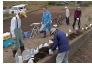
ごみ拾い後、花を植える参加者

参加者は、土手のごみを拾った後、川沿いの約100mにわたり花や球根の植え付け作業を行い、川沿いはとても綺麗に整備されていました。