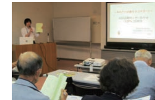
▲補助金を詳しく解説

9月20日に中央公民館で開かれた交流カフェは、市民活動センターあやせの「120%活用」をテーマに開かれ、「かながわボランティア活動推進基金21」の内容や募集要項について聞いたり、当センターの開設経緯や団体活動支援のための具体的な施策や各種情報の収集・提供などについて紹介しました。参加者は、「補助金があれば、活動がもっと広がる」と前向きな感想が寄せられました。