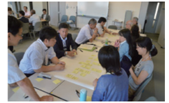
▲グループで意見交換

報告の後には4グループに分かれて活発な意見交換も行われ、「団体として知名度が上がった」「PR方法を練り直すべき」などの意見や感想が挙げられていました。