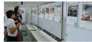
▲ポスターコンテストの様子

がじゅまるの木に1台寄贈されました。簡単な団体紹介も行った。投票によるポスターコンテスト