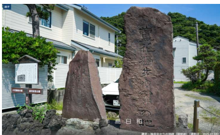
「蘆花 独歩ゆかりの地」碑