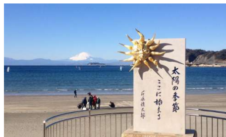
太陽の季節記念碑