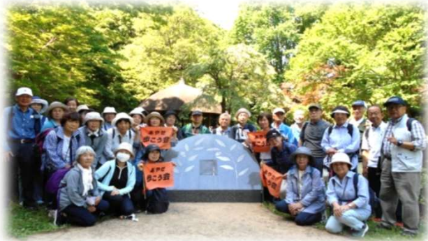
2025年5月長尾の里・東高根森林公園散策