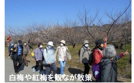
白梅や紅梅を観ながら散策