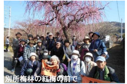
別所梅林の紅梅の前で

とにかく天気が良く富士山や箱根の山を背景に白い可憐な梅の花が咲き誇っていました。今日は梅林の中で梅の香りを感じながらみんな満足した散策ができた。(2-M.R)