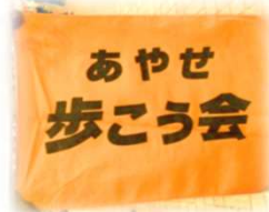
オレンジの旗が目印