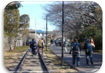
2026年1月(寒川)西寒川支線廃線跡