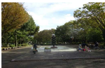
大蔵運動公園案内「噴水」