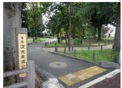
次大夫堀公園・民家園