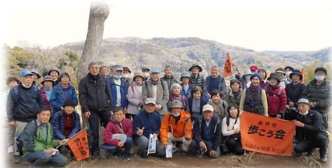
2023年2月 北鎌倉と六国見山をバックに(台峯の展望台)