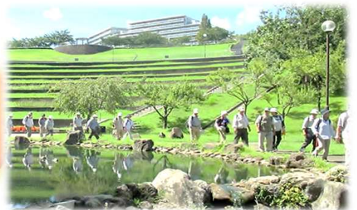
多摩 若葉台の散策