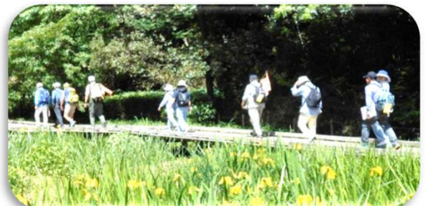
2025年5月 東高根森林公園 (湿生植物園)