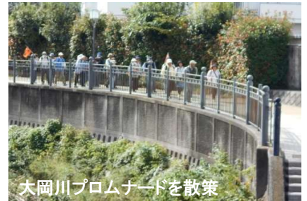
大岡川プロムナードを散策

午後アップダウンの道でフーフーしながらも小学生が描いた120段の急激な「階段アート」に着き、富士山が見えてホッと。変化に富んだコースをみなさん無事にゴールできました。(4-M.B)