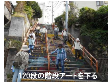
120段の階段アートを下る