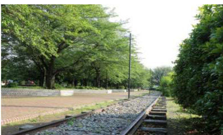
一之宮緑道廃線跡