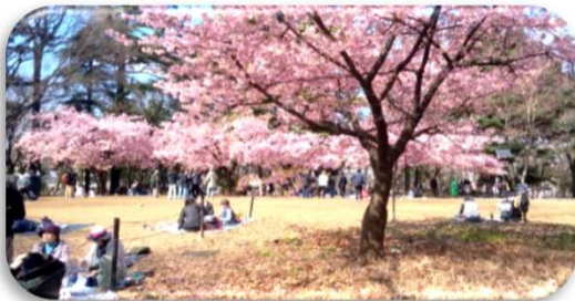
2025年3月 目黒、林試の森公園で昼食