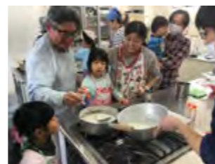
お豆腐はこうしてできるんだ！

子どもたちの自然体験を行う「地球チャイルド」が、1月20日に南部ふれあい会館で、豆腐作りを行いました。市内の畑で実った大豆をミキサーにかけて作ると、お豆のやさしい香りが広がりました。出来立ての豆腐を試食すると「とっても美味しい」と参加者は大人も子どもも歓声をあげていました。